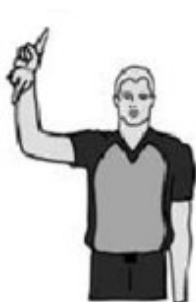
1 палец, опустить кисть