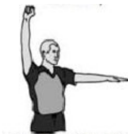
Одна ладонь сжата в кулак а другая направлена на талию провинившегося